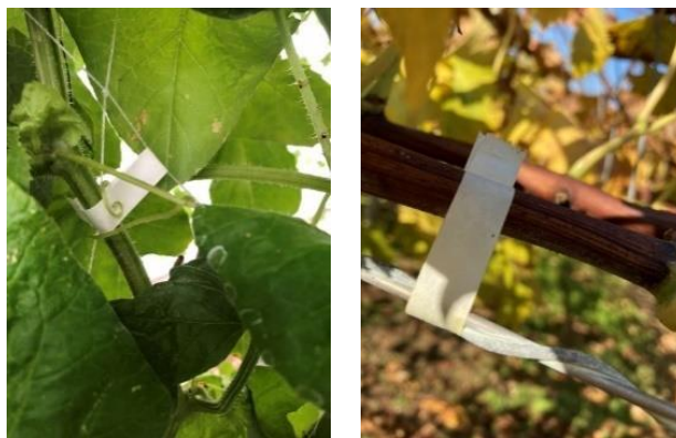
紙テープ結束イメージ