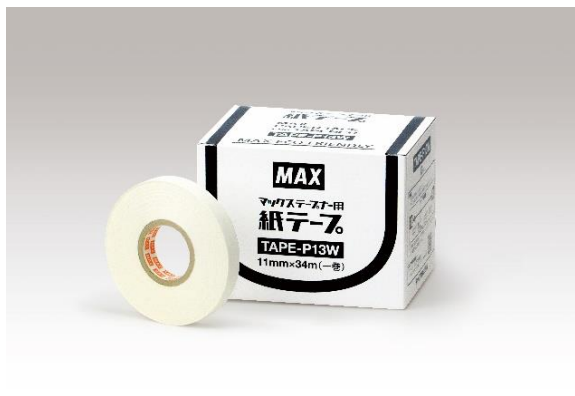
誘引結束機「テープナー」用『紙テープ』

テープナーは、トマト・きゅうり・なすといった果菜類の誘引、ブドウ・キウイフルーツをはじめとする果樹の棚誘引、ワイン用ブドウの垣根誘引などの結束作業に使用されています。